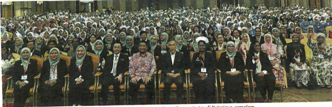
Lukanisman (tengah) bersama jururawat pada sambutan Hari Jururawat Antarabangsa 2024, di Putrajaya, semalam.

AKHBAR : BERITA HARIAN MUKA SURAT : 13 RUANGAN : NASIONAL