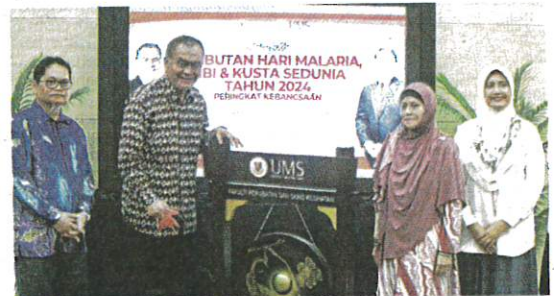
Dr Dzulkefly memalu gong sebagai simbolik merasmikan sambutan Hari Malaria, Tibi dan Kusta Sedunia 2024 di UMS, Kota Kinabalu, semalam.

"Ini adalah cabaran besar bagi kerajaan Sabah dan bersama-pengarah kesihatan negeri. Perkara penting bagi kami adalah menjaga kesihatan," katanya.