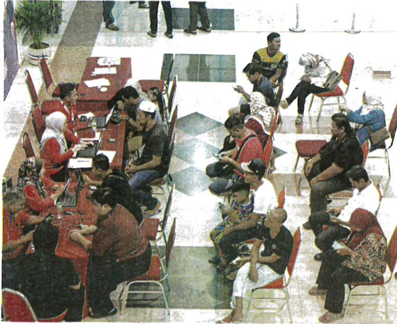
SEBAHAGIAN pencarum berurusan di kuaran untuk urusan memohon pemindahan simpanan daripada Akaun Sejahtera ke Akaun Fleksibel di pejabat KWSP Kuala Terengganu, semalam.

"Walau wang dalam Akaun Sejahtera tidak banyak tetapi jumlah