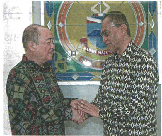
Health matters: Hajiji (left) welcoming Dzulkefly during a courtesy call at Seri Gaya in Kota Kinabalu.

"The important thing for us is to take care of our health. Things like not having documentation