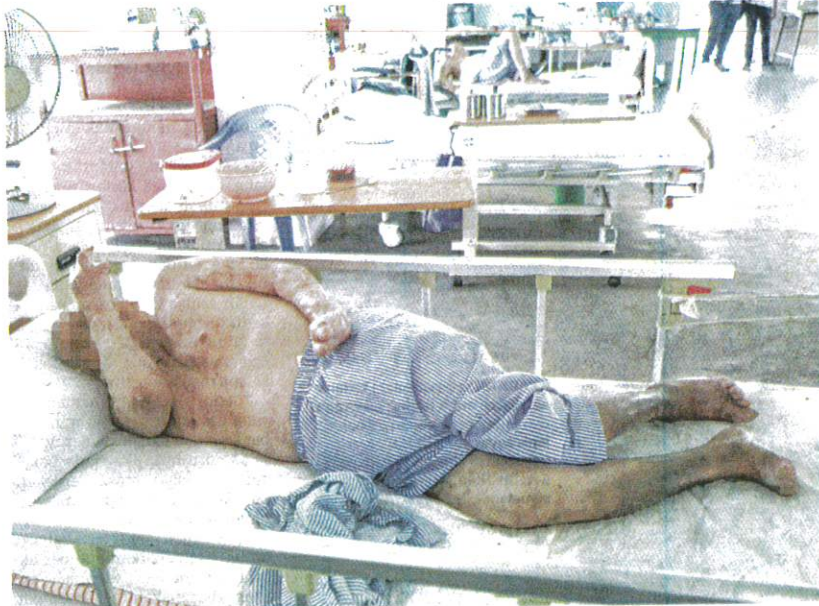
KEADAAN pesakit-pesakit kusta yang masih menerima rawatan di Pusat Kawalan Kusta Negara, Sungai Buloh, Selangor.

AKHBAR : HARIAN METRO MUKA SURAT : 21 RUANGAN : LOKAL